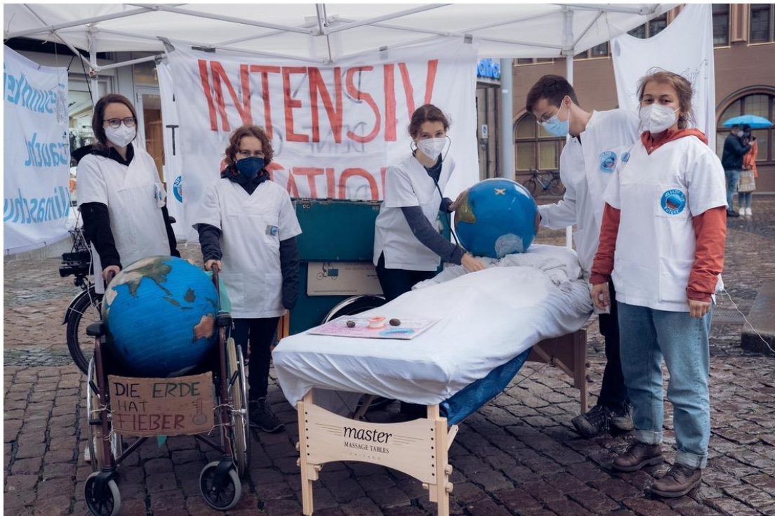
Health for Future Freiburg mit einer Klimaintensivstation.

Außerdem sollen die Zusammenhänge zwischen Klimaschutz und Gesundheit auch in der Öffentlichkeit stärker präsent werden. So veranstaltet Health for Future Freiburg seit März monatliche Mahnwachen.