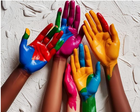
Abbildung 5: Transformation wagen

Inhalt: Zum Abschluss des Kurses reflektieren die Schüler:innen insbesondere ihre eigene Rolle als Physiotherapeut:innen in der Ernährungswende , nicht nur sprachlich, sondern auch mit kreativen Methoden. Darüber hinaus wird ihre Rolle in die große Transformation eingebettet und sie lernen das Konzept der Sozialen Kipppunkte kennen.