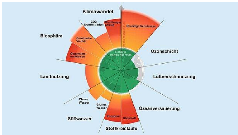
Abbildung 2: Planetare Grenzen.

Inhalt: Im zweiten Themenblock mit insgesamt 4 UE beleuchten wir den Einfluss unserer Ernährung und Mobilität auf die verschiedenen Planetaren Belastungsgrenzen : Wodurch entstehen Treibhausgase in der Landwirtschaft und im Verkehr? Wie hängen das dramatische Artensterben, die Verschmutzung von Luft, Wasser und Böden und die Veränderung von Nährstoffkreisläufen sowie Zoonosen mit der Art und Weise unserer Ernährung zusammen? Welche Auswirkungen hat unser Verkehr neben der CO 2 -Konzentration noch auf unser Klima? Themenblock 2 besteht aus zwei Teilen.