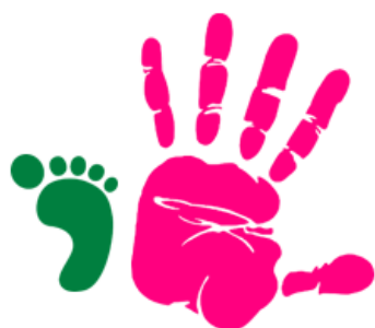
Abbildung 2: Hand- und Fußabdruck Quelle: eigene Darstellung

Inhalt: Die Schüler:innen wiederholen die Inhalte der Themenblöcke 1 und 2 und erarbeiten die wichtigsten Botschaften. Außerdem reflektieren und benennen sie ihre eigenen Gefühle zur Thematik. Ziel ist ein Innehalten, die Auseinandersetzung mit Werten und Zielkonflikten , Stärkung des Gruppengefühls und die Vorbereitung auf ihre Rolle als Akteur:innen.